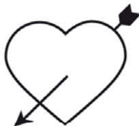
Herz mit Pfeil #002